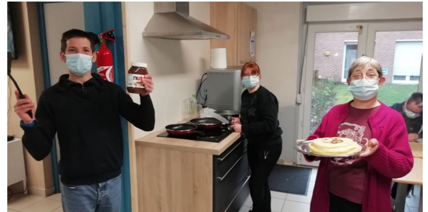
Une fois l'installation faite, les résidents ont pu inaugurer les cuisines, en y préparant de bons petits plats et pâtisseries.